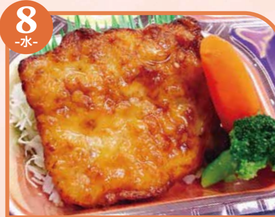
8 -水- グリルチキン エネルギー288kcal / タンパク質11.9g / 脂質15.8g