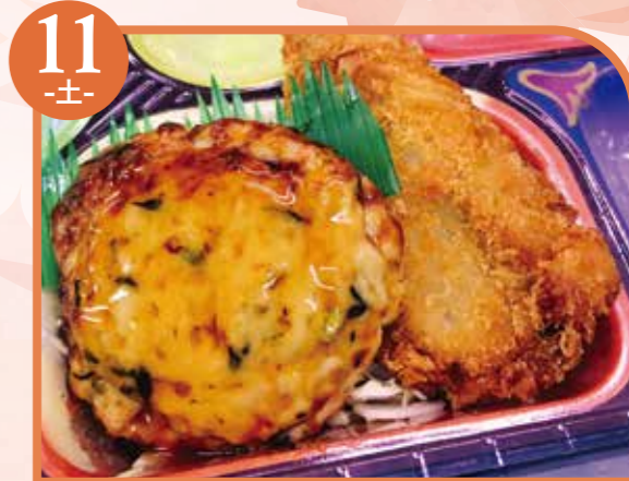
11 -土- 豆腐ハンバーグ エネルギー305kcal / タンパク質16.7g / 脂質12.2g