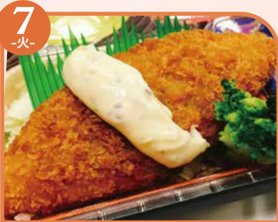
7 -火- 白身フライ エネルギー426kcal / タンパク質14.6g / 脂質24.3g