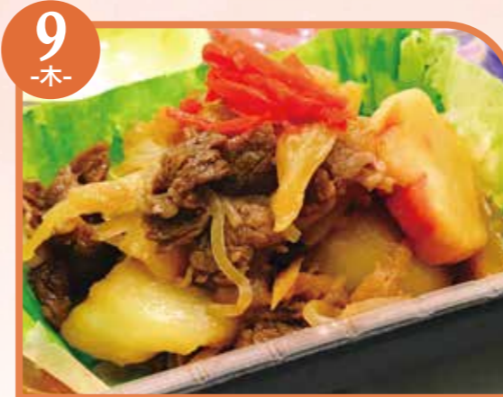
9 -木- すき焼き風煮 エネルギー328kcal / タンパク質13.4g / 脂質11.9g