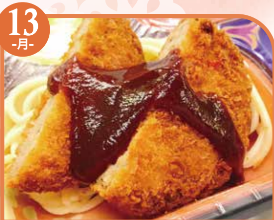
13 -月- メンチカツ エネルギー442kcal / タンパク質15.2g / 脂質22g