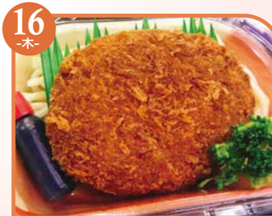
16 -木- カレールーフライ エネルギー325kcal / タンパク質9.5g / 脂質13.1g