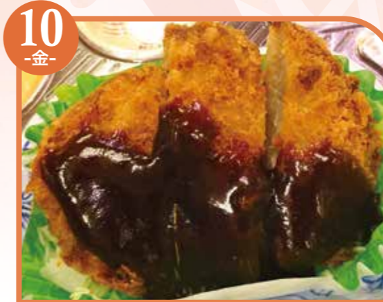
10 -金- 味噌カツ エネルギー333kcal / タンパク質11.6g / 脂質17.4g