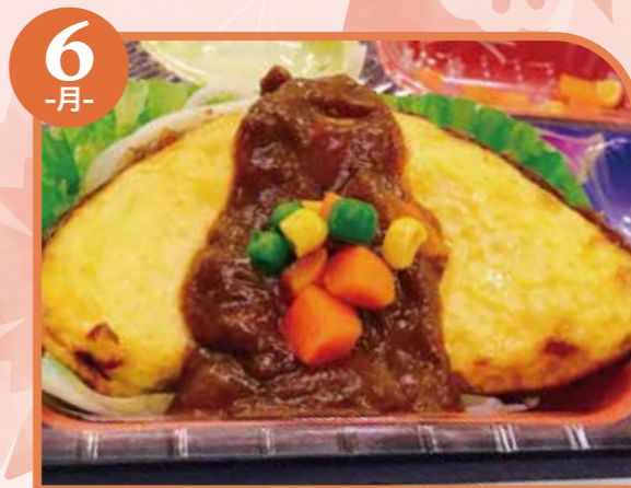
6 -月- オムレツカレーソース エネルギー351kcal / タンパク質13.6g / 脂質16.2g