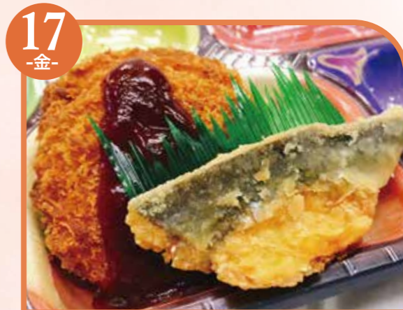
17 -金- えびカツとさば竜田 エネルギー402kcal / タンパク質18.7g / 脂質18.5g