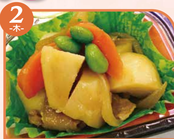
2 -木- 肉じゃが エネルギー246kcal / タンパク質10.5g / 脂質4.5g