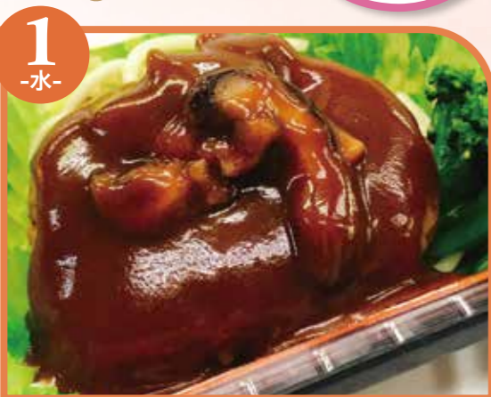
1 -水- ハンバーグデミグラスソース エネルギー383kcal / タンパク質14.5g / 脂質18.5g

栄養成分表記はおかずのみの成分値です。 ご飯は、100gあたり168kcalです。