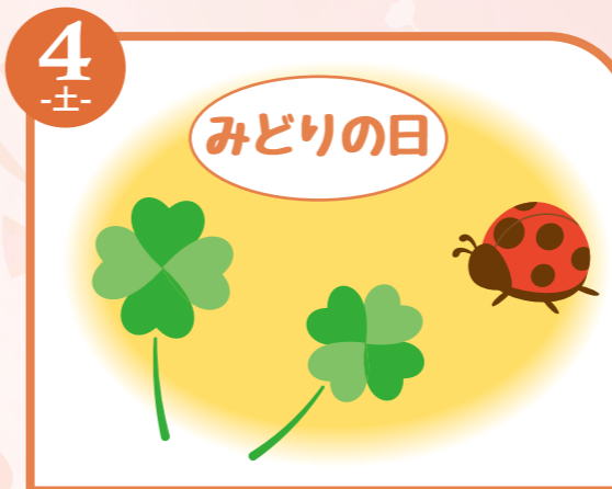
4 -土- みどりの日