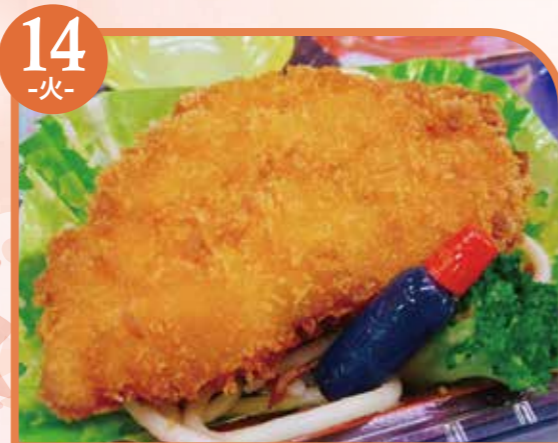
14 -火- ハムサンドフライ エネルギー387kcal / タンパク質11.6g / 脂質19.7g