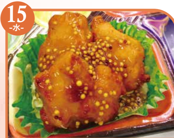
15 -水- 鶏唐揚げハニーマスタードソース エネルギー469kcal / タンパク質13.5g / 脂質27.6g