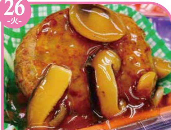
ハンバーグ和風あん