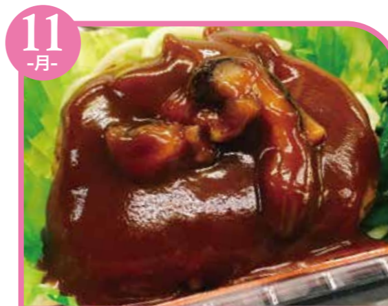
11 -月- デミグラスハンバーグ エネルギー356kcal / タンパク質11.6g / 脂質14.6g