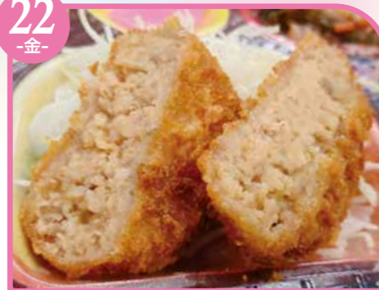
チーズメンチカツ