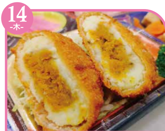
14 -木- かぼちゃクノーデル エネルギー336kcal / タンパク質8.3g / 脂質14.3g