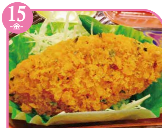
15 -金- 白身魚の青のりフライ エネルギー307kcal / タンパク質11.1g / 脂質15.2g