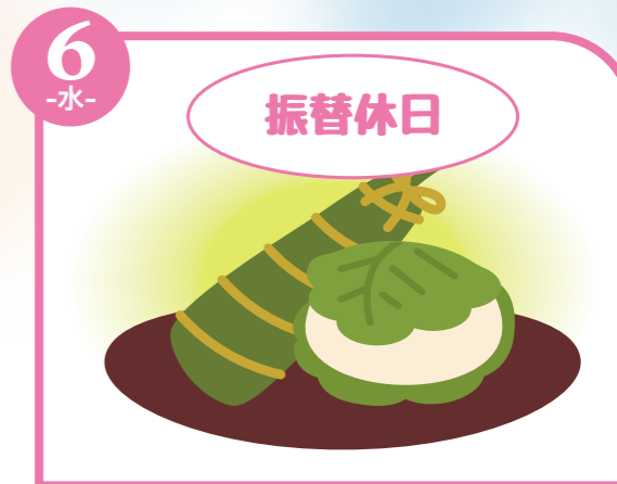
6 -水- 振替休日