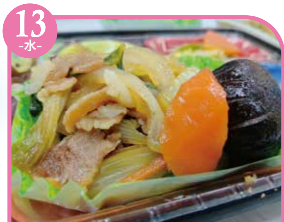
13 -水- すき焼き風煮 エネルギー309kcal / タンパク質11.7g / 脂質15.6g