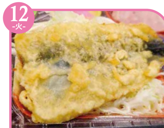
12 -火- いわしの天ぷら エネルギー253kcal / タンパク質11.3g / 脂質12g