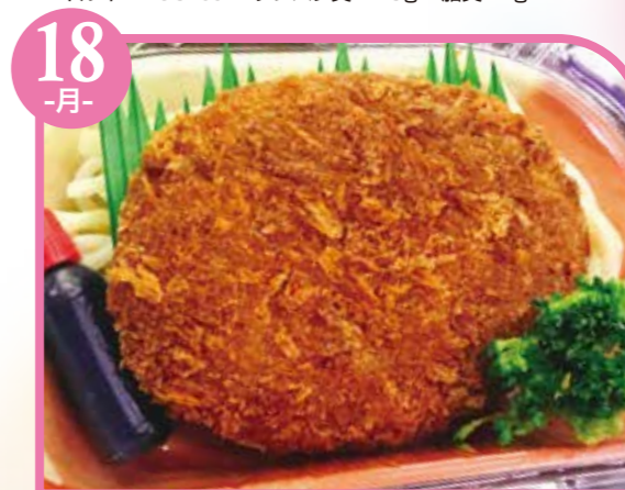
18 -月- カレーウフライ エネルギー360kcal / タンパク質8.3g / 脂質18.1g