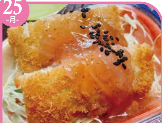
フィッシュフライ梅ソース