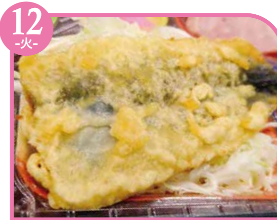
12 -火- いわしの天ぷら エネルギー253kcal / タンパク質11.3g / 脂質12g