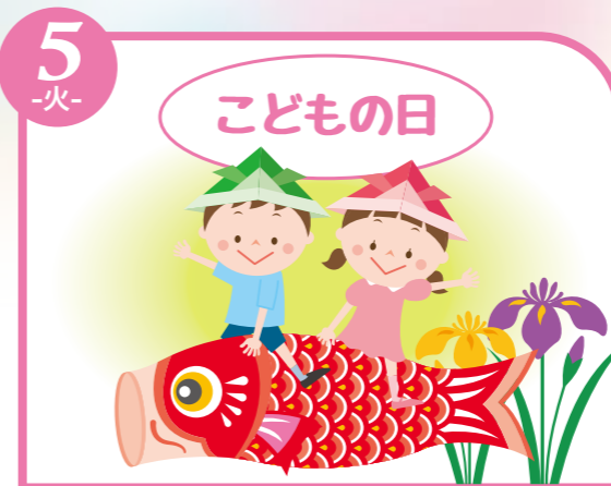
5 -火- こどもの日