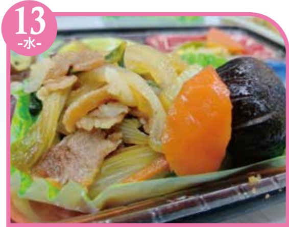
13 -水- すき焼き エネルギー309kcal / タンパク質11.7g / 脂質15.6g