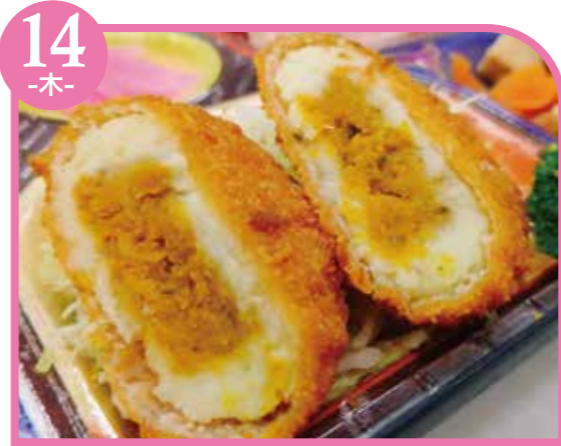
14 -木- かぼちゃノーデル エネルギー336kcal / タンパク質8.3g / 脂質14.3g