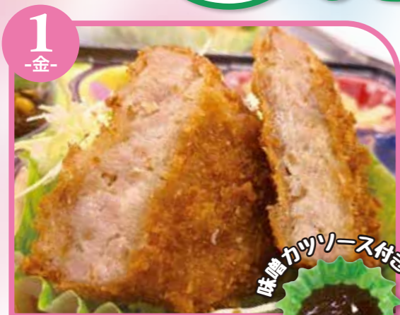
1 -金- 味噌カツ エネルギー309kcal / タンパク質11.7g / 脂質15.6g

栄養成分表記はおかずのみの成分値です。 ご飯は、100gあたり168kcalです。