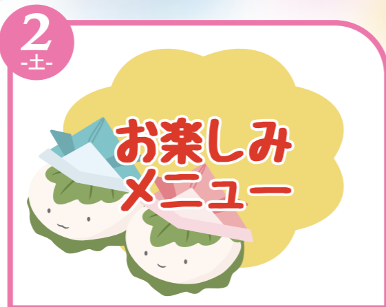
2 -土- お楽しみ メニュー