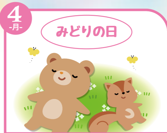
4 -月- みどりの日