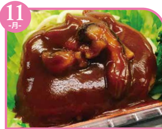
11 -月- デミグラスハンバーグ エネルギー356kcal / タンパク質11.6g / 脂質14.6g