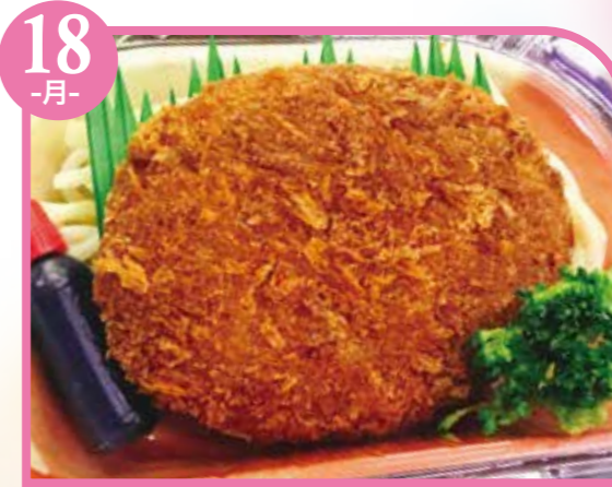
18 -月- カレーうどんフライ エネルギー360kcal / タンパク質8.3g / 脂質18.1g