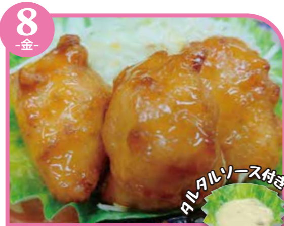
8 -金- チキン南蛮 エネルギー443kcal / タンパク質12.4g / 脂質30.8g