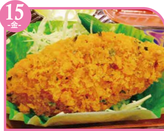
15 -金- 白身魚の青のりフライ エネルギー307kcal / タンパク質11.1g / 脂質15.2g