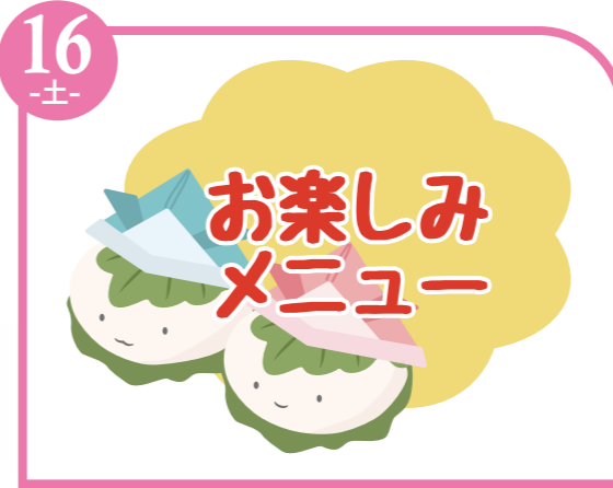
16 -土- お楽しみ メニュー