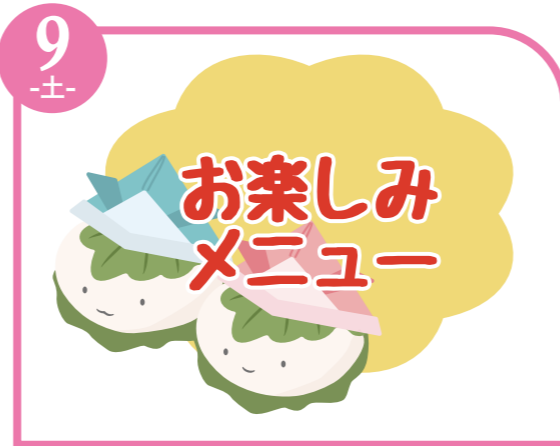
9 -土- お楽しみ メニュー