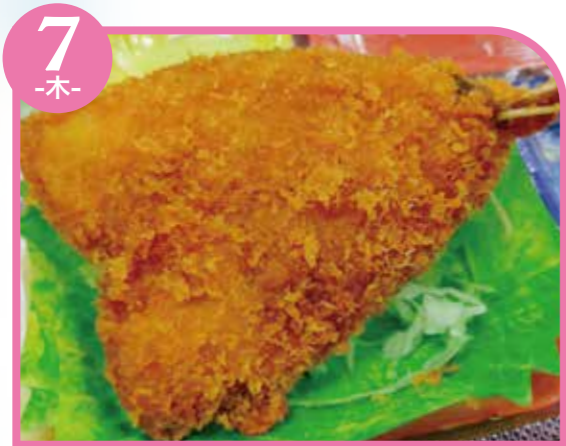
7 -木- アジフライ エネルギー284kcal / タンパク質12.2g / 脂質14.3g