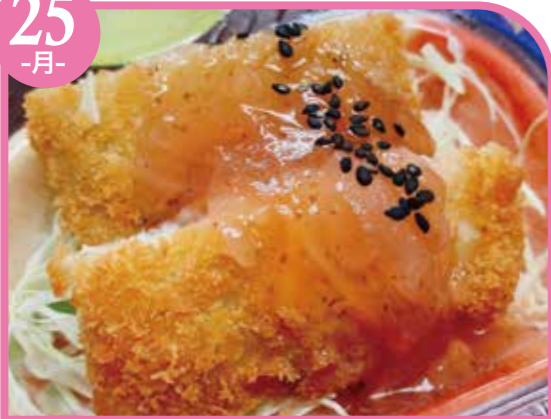
フィッシュフライ梅ソース